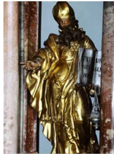
Der greise Simeon

Der Altaraufbau stammt vom Stuckateur Bartlmä Gratl aus Amras (1748/49). Die Statuen wurden vom Bildhauer Balthasar Horer aus dem Kaunertal (Oberinntal) geschaffen – wohl noch in Zusammenarbeit mit Johann Baptist Forster - und vom Maler Joseph Wengenmayr aus Leininger (D) gefasst, der die Seele der ganzen Arbeit gewesen zu sein scheint und alles aufeinander abgestimmt hat. Bartlmä Gratl hat auch das Chorgewölbe mit Stuckaturen geschmückt.