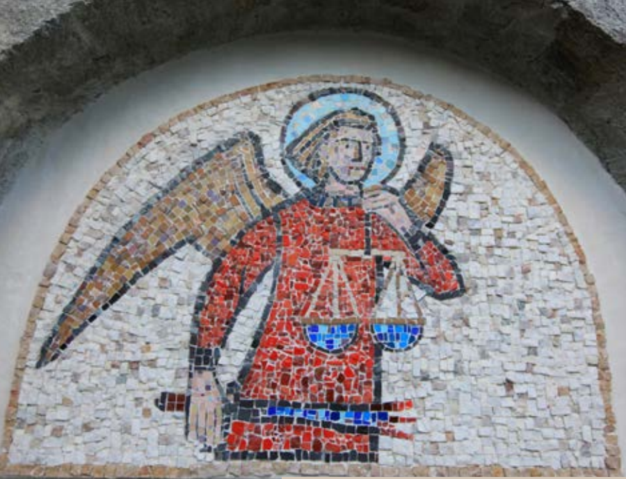
Denkmal für die Gefallenen von 1809

tung verantwortlich. Das Mosaik wurde vom Künstler aus Passeirer Marmor, Schieferstein, Ton, Fliesen und Glas gestaltet und stellt den Erzengel Michael mit Flammenschwert und Seelenwaage dar. Michael geleitet ja die Verstorbenen in den Himmel und ist Patron der Soldaten und Krieger.