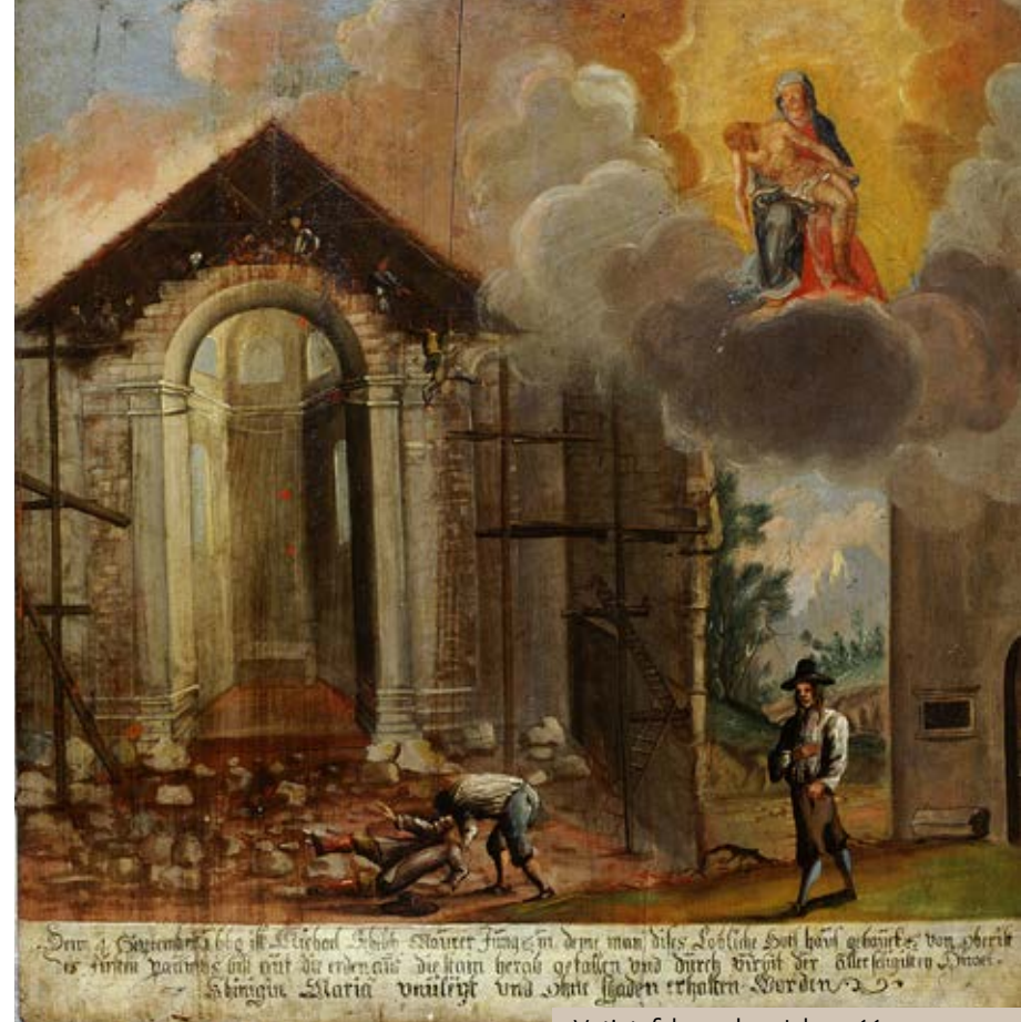
Votivtafel aus dem Jahre 1669

Die Wallfahrtskirche gilt als ein besonderer Ort der Kraft, an dem vor allem Gebetserhörungen bei seelischen Leiden wie Schwermut erfahren wurden und werden.