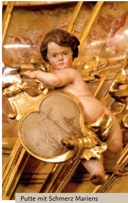
Putte mit Schmerz Mariens

eine sehr schöne Tonarbeit aus der Zeit um 1415. Der kunsthistorischen Fachsprache nach ist es ein Vesperbild, d. h. übersetzt „Abendbild“: Am Abend des Karfreitags hält Maria den blutüberströmten Leichnam ihres Sohnes im Schoß und beweint seinen Tod.