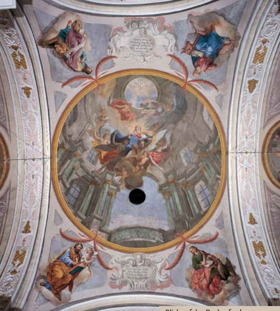
Blick auf das Deckenfresko

des 18. Jh.). Die Jahreszahl 1716 auf den Wappenschildern bezieht sich auf den Altarbau, die Wappen verweisen auf die Stifter: Fieger vom Bergwerk im Ahrntal und Grafen Mamming von Schneeberg (durch Heirat miteinander verbunden).