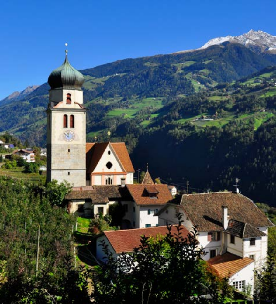
Pfarr- und Wallfahrtskirche „Zu den Sieben Schmerzen Mariens“ in Riffian