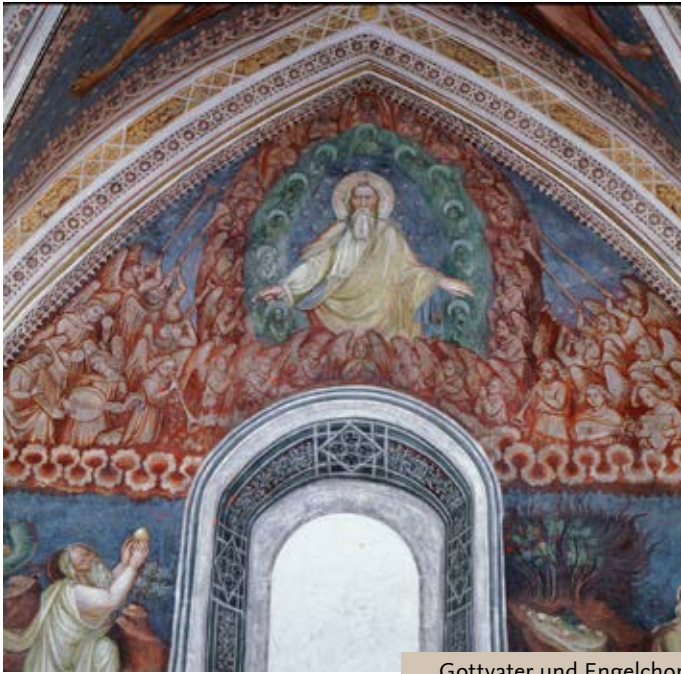
Gottvater und Engelchor

eine Weihe erhielt, sind vollständig mit Fresken ausgeschmückt. An den Seitenwänden und an der Eingangsfront aber sind Teile davon durch das Ausbrechen der Rundfenster in der Barockzeit verloren gegangen.