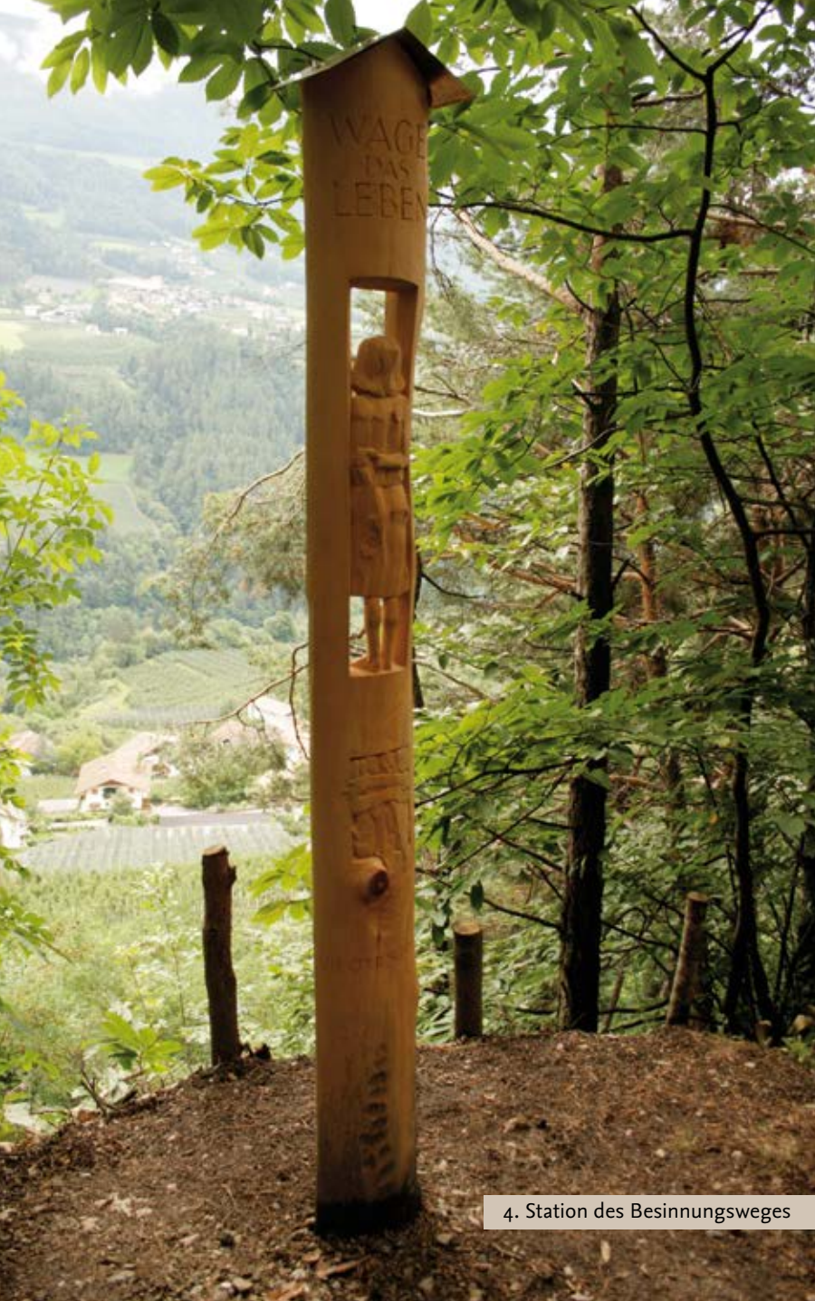
4. Station des Besinnungsweges

ren mit Privatautos bzw. Bussen bis ins Dorfzentrum und gehen das letzte Stück zu Fuß den Kirchweg entlang – vorbei an den ansprechenden Kreuzwegstationen mit den Bronzereliefs von Guido Lezuo (1958). Wieder andere Pilger kommen über den „Riffianer Waalweg“ von Kuens