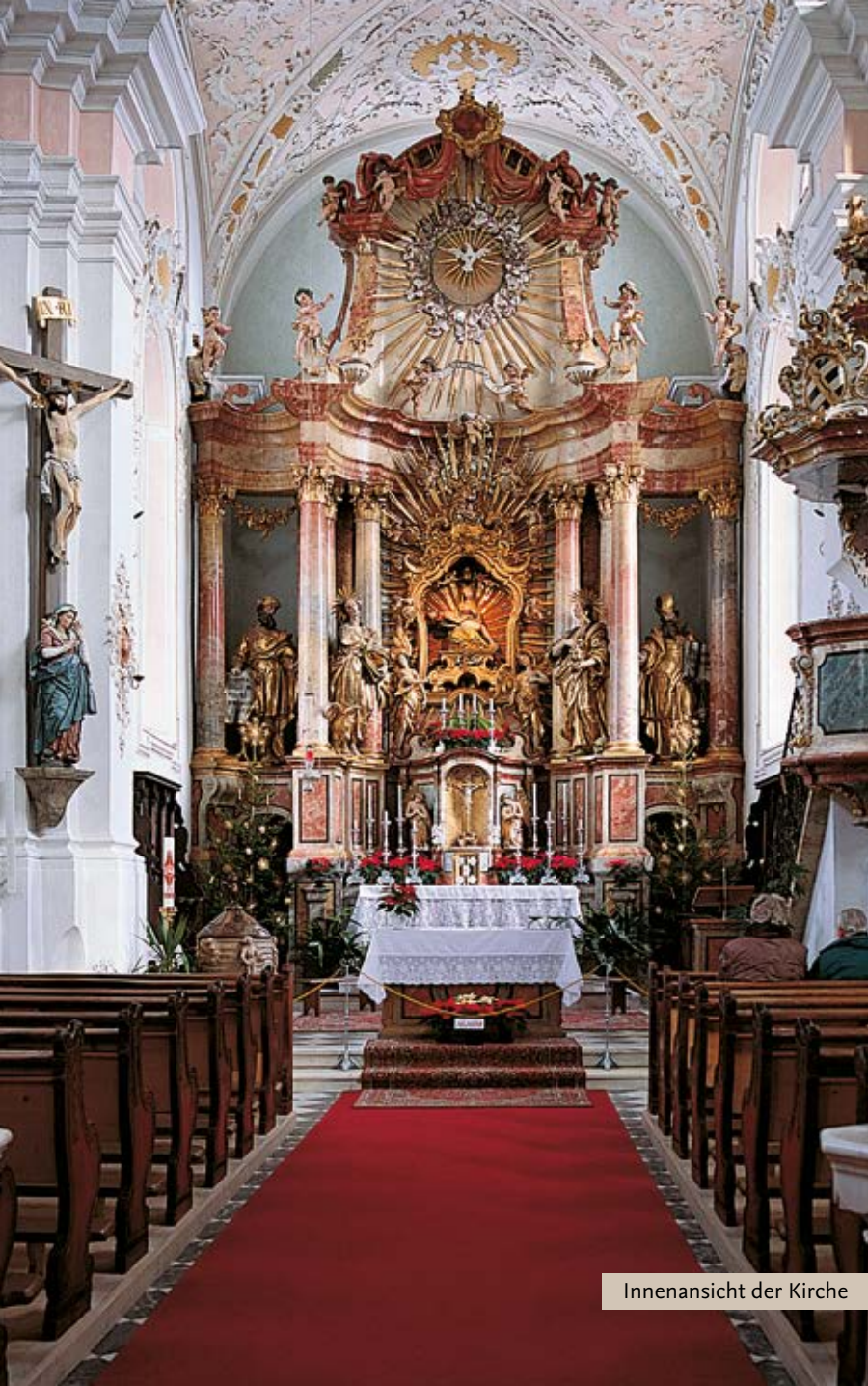
Innenansicht der Kirche